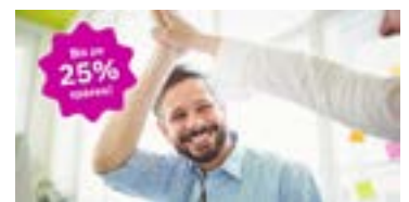
Abb. 2: Foto, bis zu 25% sparen